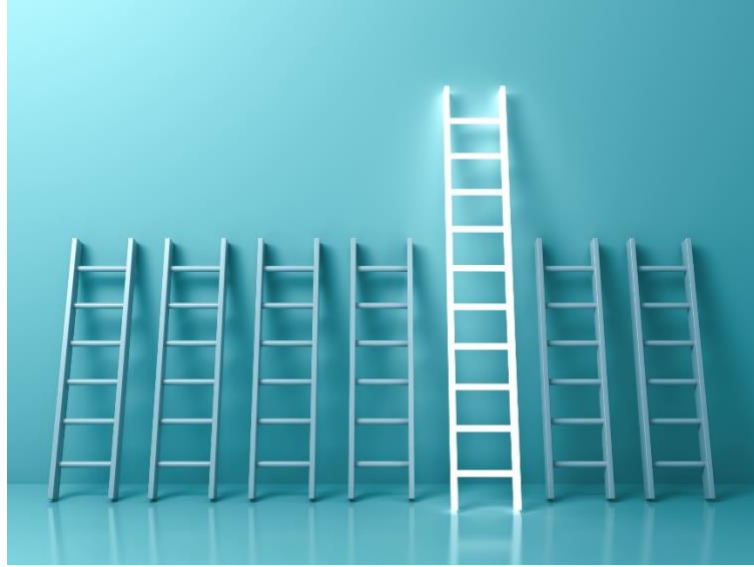
رسم توضيحي 2 : الحلول

هناك العديد من التحديات التي قد يمر بها عملك في بعض المراحل ، مثل مواسم البيع المنخفضة أو التغيير في اتجاهات السوق ؛ يمكن أن تساعدك خطة العمل على مواجهة هذه التحديات والاستعداد لها