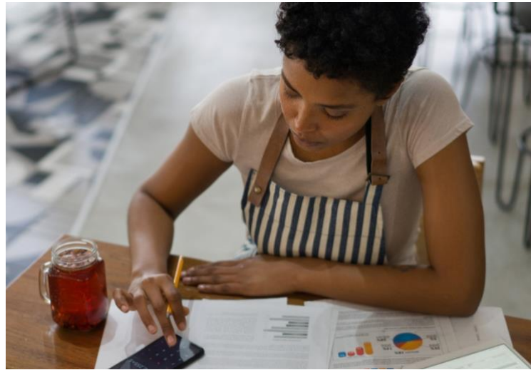
رسم توضيحي 1: خطة العمل