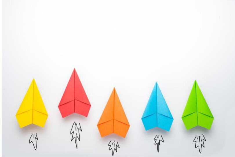
رسم توضيحي 4 : مزايا

نظرًا لأنه من السهل جدًا فهم اللوحة ، فستتمكن من مشاركتها مع فريقك وشرحها لهم بسهولة مما يسهل عليك إشراكهم في رؤيتك .